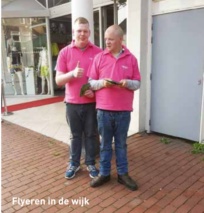
Flyeren in de wijk