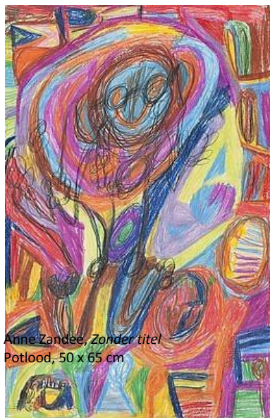
Anne Zandee, Zonder titel Potlood, 50 x 65 cm

Cliëntenorganisaties behoren ook tot de doelgroep. Het bestuur van SpAr zal hieraan aandacht schenken.