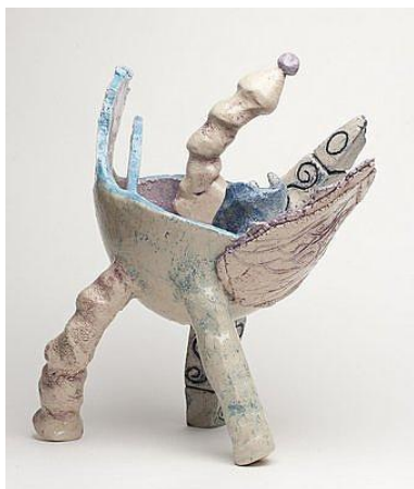
Olga de Bruin, Spanje Keramik, 22 x 33 cm

Stichting Special Arts Nederland (roepnaam Special Arts) is vanaf 2008 de naam van een slagvaardige, flexibele organisatie die is ontstaan door een samengaan van Very Special Arts Nederland, Stichting K4 uit Purmerend en de Stichting Art As Well/Een Hele Kunst uit Amsterdam.