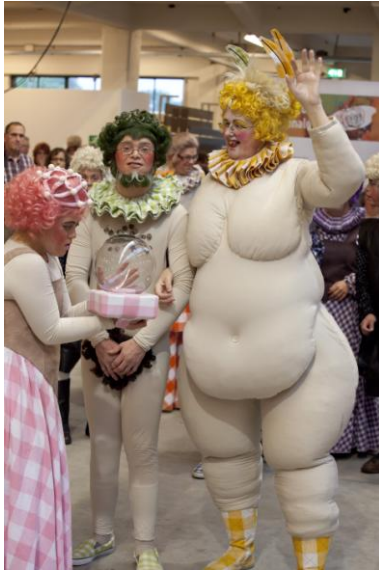
Theater Kamak tijdens de opening van de Art Brut Biënnale 2012